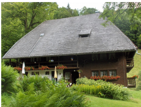
Abbildung 8: Bruggerhof