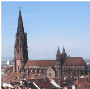
Abbildung 14: Freiburger Münster