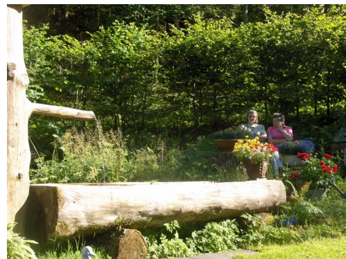
Abbildung 7: Bruggerhof

Beide Gruppen treffen sich um ca. 16.00 Uhr am Bruggerhof. Anschließend Rückfahrt zum Hotel.