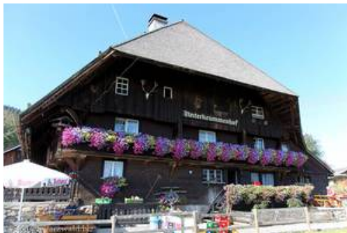
Abbildung 9: Restaurant Unterkrummenhof