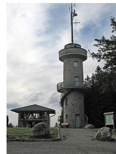
Abbildung 5: Brend (Aussichtsturm)

= ca. 8 km – keine großen Höhenunterschiede