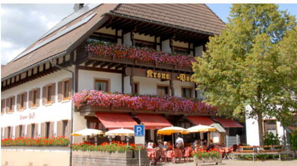
Abbildung 2: Hotel Krone - Post

Einchecken im Hotel, erkunden des Umfeldes, Abendessen