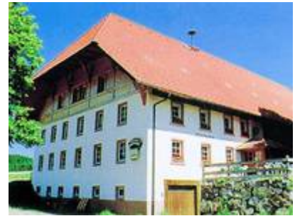
Abbildung 3: Plattenhof