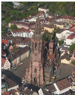
Abbildung 13: Freiburg