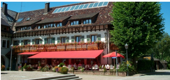
Abbildung 16: Restaurant "Zum Hirschen" in St. Peter