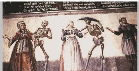
Abbildung 11: Totentanz in der Kirche Bleibach