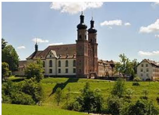
Abbildung 15: Benediktinerabtei St. Peter