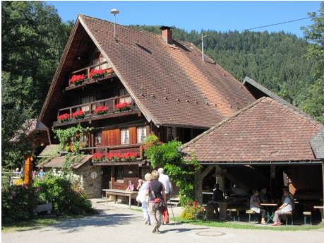
Abbildung 1: Alte Ölmühle

Fahren über Flughafen – Darmstadt – A 5 bis Freiburg - Nord, dann nach Autobahnabfahrt an Ampel links in Richtung Waldkirch. Nach dem Tunnel vor Waldkirch rechts in Richtung Simonswald (ausgeschildert).