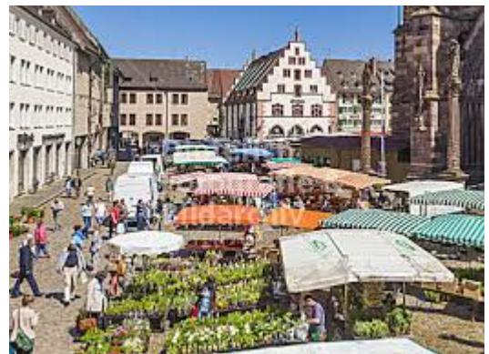
Abbildung 12: Münsterplatz mit Markt